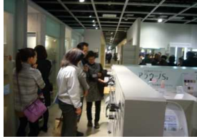
パナソニックショールーム 東京汐留 見学