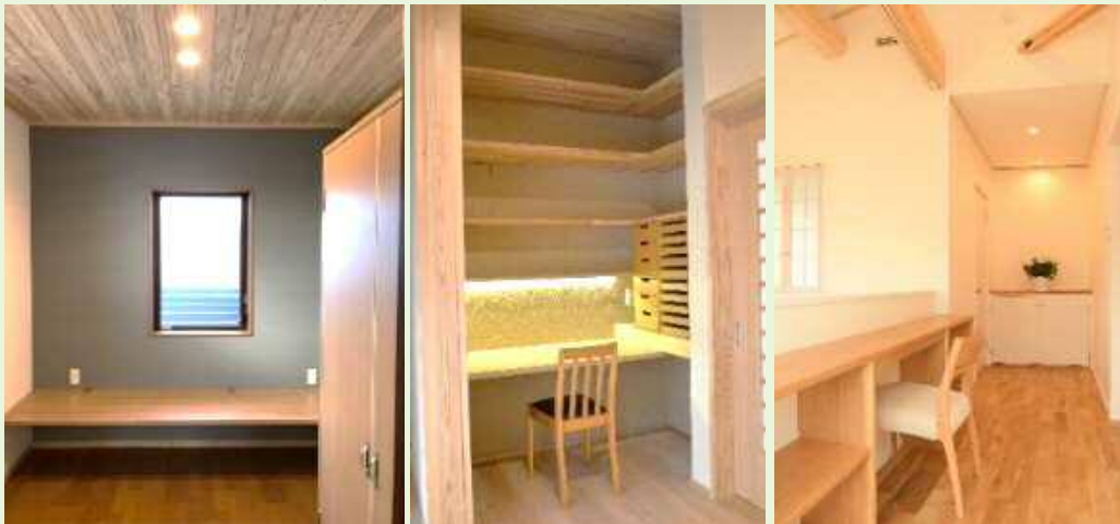
ウォークインクローゼットの中に…